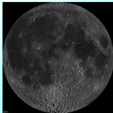
月の表側の写真