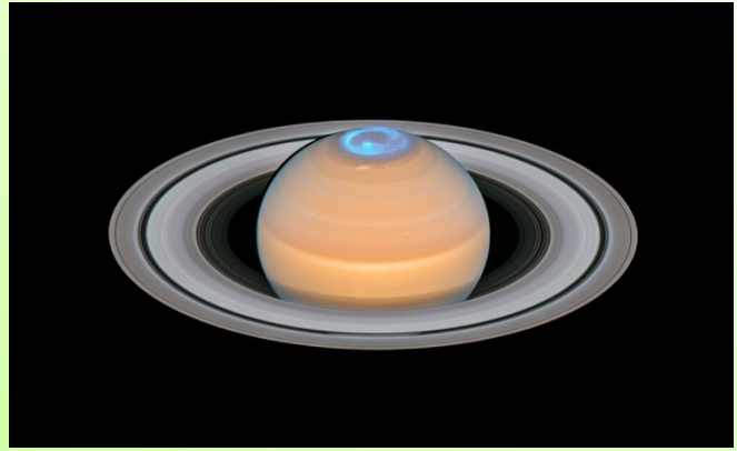
土星のオーロラ

申込方法 3月26日 (火) 申込み〆切 ・ インターネットの場合は http://www.tenmon.org/ ・ お電話の場合は 075-823-3640 (10:00-18:00 受付) 株式会社ビューティフルツアー (担当：ウルシハラ)